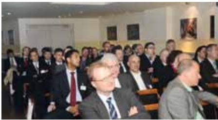
Rund 50 Unternehmer nutzten den Workshop

können. Das war eine gute Schule und hat dem Unternehmen sicher nicht geschadet.“